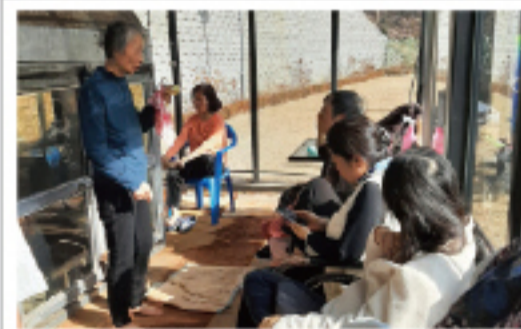
▲ 광토와 찜질