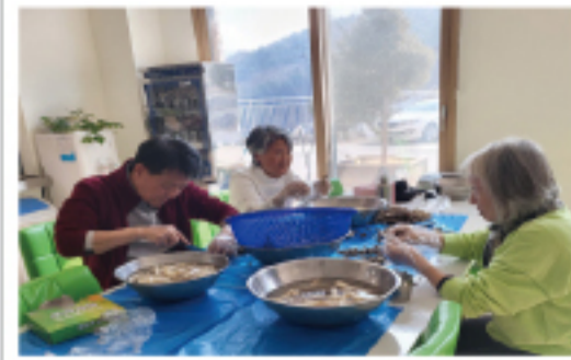
▲ 더덕손질 삼매경