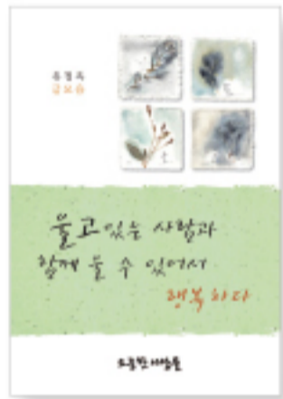
울고 있는 사람과 함께 울 수 있어서 행복하다 (유정옥·정가 10,000원)

고통 받는 이웃들에게 작은 도움이 되고자 했던 유정옥 사모의 신앙생활을 담은 에세이 고아가 된 어느 남매를 맡아 키운 이야기 생면부지의 암환자를 봉양한 이야기 먼 나라 카자흐스탄에서 복음을 전파한 이야기 등 삶의 굽이마다 펼쳐진 따뜻한 이야기들을 전해준다.