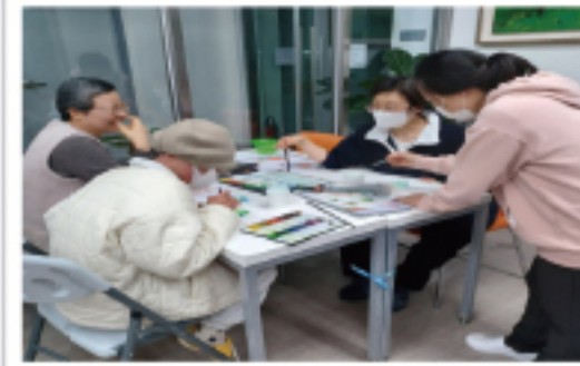
▲ 미술치리로 건강을...