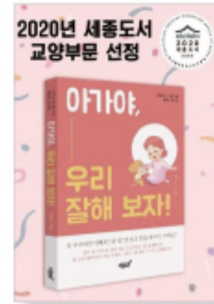
<아가야, 우리잘해 보자!> (박선인·정가 12,000원)

12명의 YES24 회원이 평가한 평균별점 9.7 /10.0 두 아이를 키우는 박선인 사모가 실제로 아이와 겪는 갈등과 어려움을 아이에 대한 진정한 사랑과 감동으로 풀어가는 영롱한 이슬 같은 예쁜 이야기 글 모음이다.