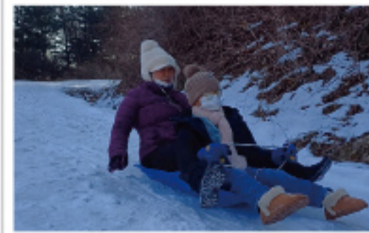
▲ 신나는 눈썰매~