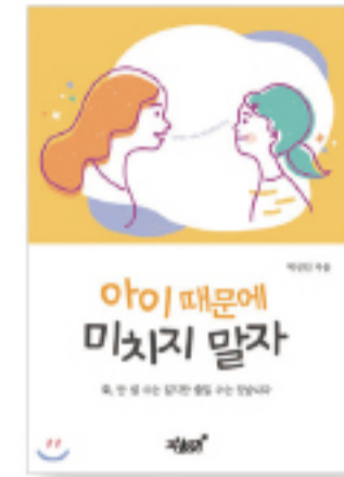
<아이때문에 미치지 말자!> (박선인·정가 12,000원)

박선인 사모의 우리아이를 위한 예쁜 글모음, 그 두번째 내 아이를 위한 사랑과 감동의 이야기... 우리 아이를 독립적인 인격체로 양육해 가는 세밀한 과정을 사랑의 마음으로 비추어 볼 수 있는 사랑의 이야기. 이 책은 우리 아이뿐만 아니라 힘들고 지친, 자존감을 상실한 어른들에게도 사랑과 힘이 깃들게 되는 선한 지침서와도 같은 사랑과 지혜가 담긴 글 모음이다.