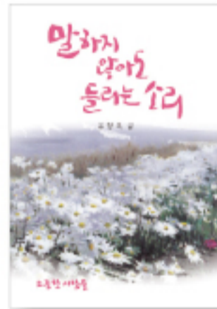
말하지 않아도 들리는 소리 (유정옥·정가 12,000원)

<말하지 않아도 들리는 소리>는 서울역 노숙인들 곁에서 18년간 함께 해온 유정옥 사모가 그곳에서 마주한 아름다운 사람들과의 이야기와 자신이 살아오며 보고 듣고 느낀 것들에 대한 이야기를 담아낸 책이다. 넘어졌을 때 다시 일어날 수 있게 해주고 두려워할 때 다시 힘을 얻게 해주는 이야기들이 가득하다.