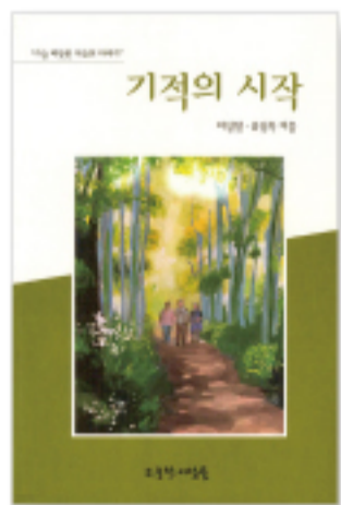
기적의 시작 (이성일·유정옥·정가 14,000원)

31명의 환우들이 완전한 치유를 통해 얻은 이 시대의 치료의 교과서 "기적의 시작"은 계속될 것이다.