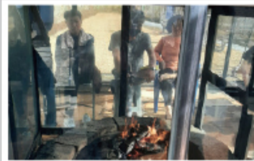
▲ 찜질방 그리고 수다