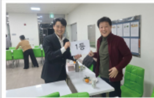
▲ 적사대회 시상