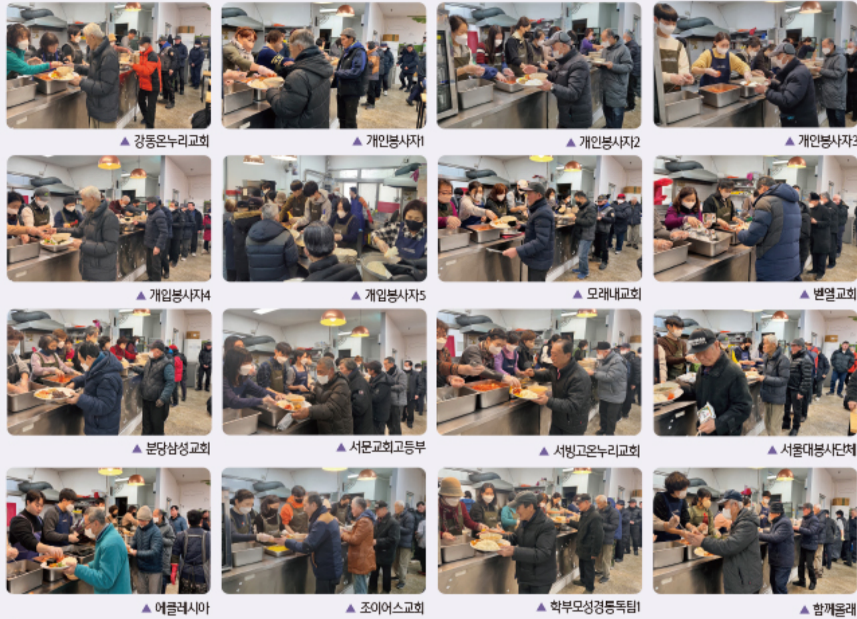
▲ 강동온누리교회 ▲ 개인봉사자 ▲ 개인봉사자2 ▲ 개인봉사자3 ▲ 개인봉사자4 ▲ 개인봉사자5 ▲ 모래내교회 ▲ 변열교회 ▲ 분당삼성교회 ▲ 서문교회고등부 ▲ 서빙고온누리교회 ▲ 서울대봉사단체 ▲ 에클레시아 ▲ 조이어스교회 ▲ 학부모성경동독팀 ▲ 함께올래