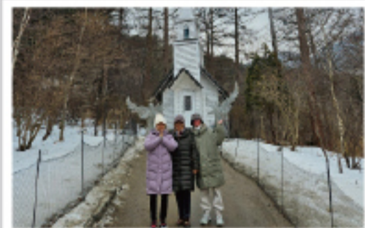
▲ 치유의 길