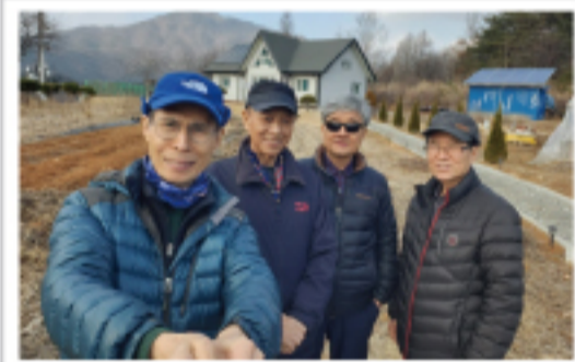
▲ 완치환우먹 방문