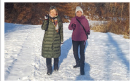
▲ 첫눈 밟으며...