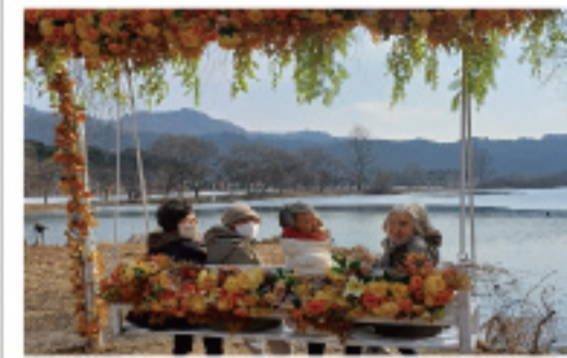
▲ 소망의 햇살 받으며...