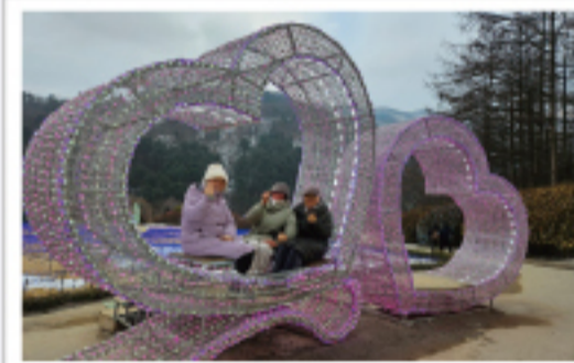
▲ 최고의 선물..사랑