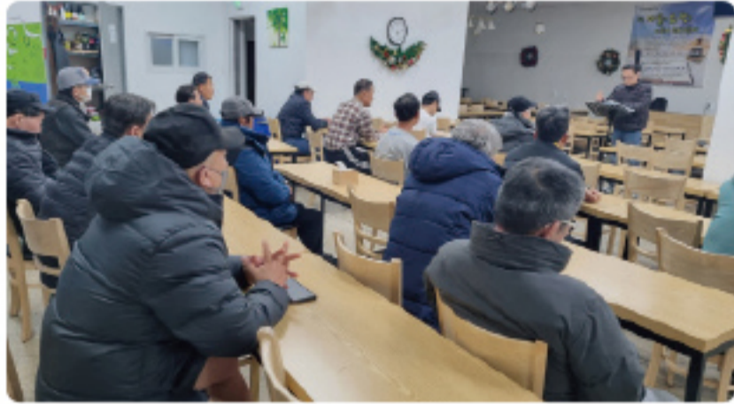
▲ 생활인 큐티