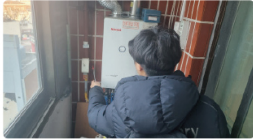
▲ 가스시설 정기검사