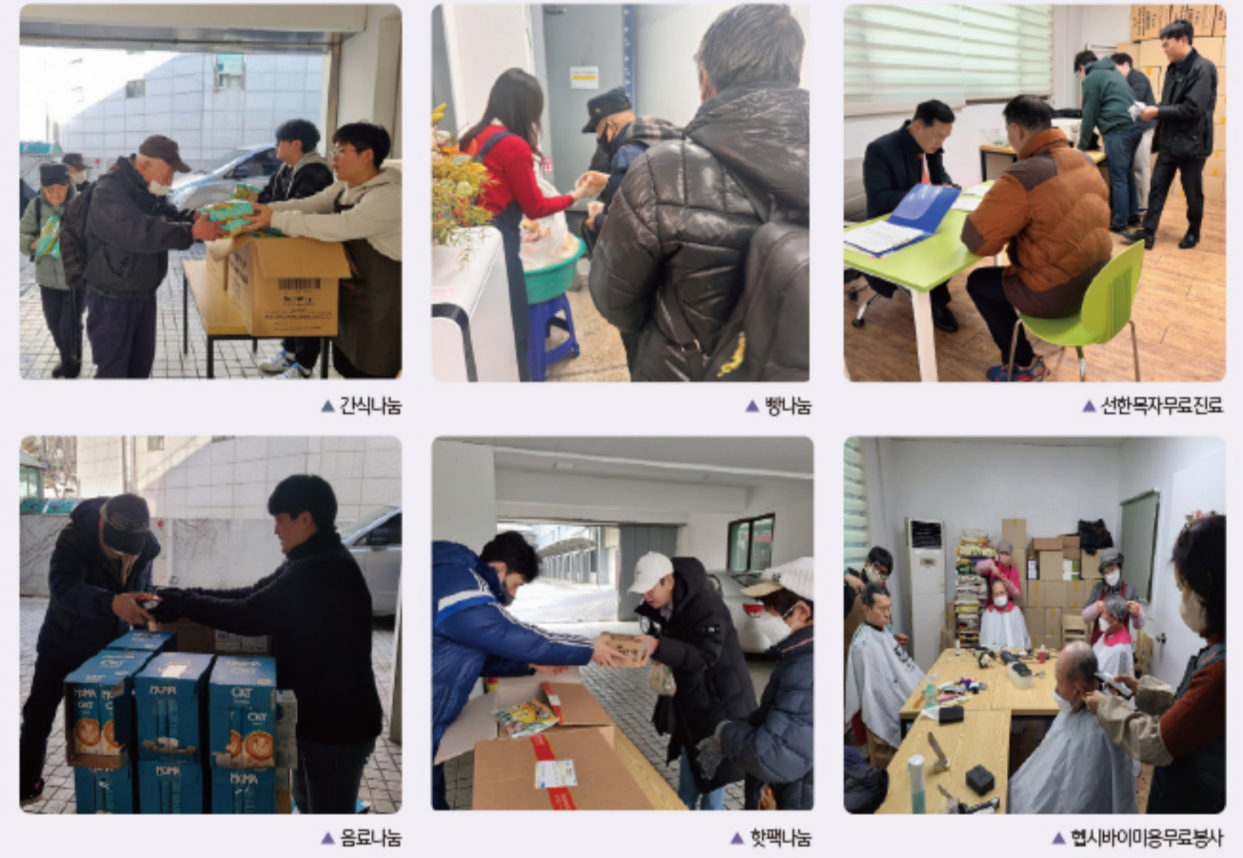
▲ 간식나눔 ▲ 빵나눔 ▲ 선한목자무료진료 ▲ 음료나눔 ▲ 핫팩나눔 ▲ 현시바미용무료봉사

소중한사람들 교회 매일 오전 11시 예배와 점심나눔 노숙인들이 마음 놓고 주님께 예배하기 위해 세워주신 노숙인 전용 교회인 소중한사람들 교회는 명절이나 휴일도 없이 365일 하루도 쉬지 않고 예배를 드려온 지 20년을 맞이 했습니다. 소중한사람들은 하루도 쉬지 않고 매일 예배를 드리고 하루 200명의 노숙인들에게 점심을 나누고 있습니다.