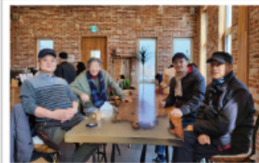
▲ 힐링센터 사나이들