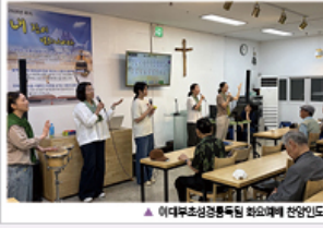
▲ 이대부초성경통독팀 회오매에 찬양인도