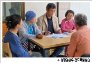
▲ 청평힐링센터 진료목담심습