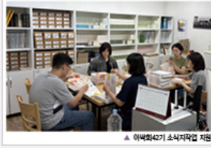
▲ 이백희42기 소식지작업 지원