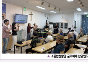
▲ 소중한찬양단 회오매에 찬양인도