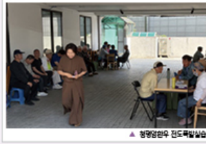
▲ 청평힐링센터 진료목담심습