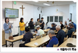
▲ 에클레시아 특송