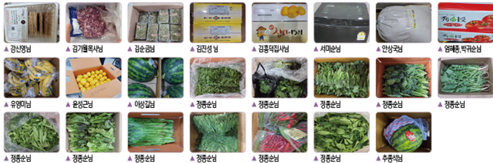
▲ 장산면님 ▲ 김기철목사님 ▲ 김순금님 ▲ 김진성님 ▲ 김홍택목사님 ▲ 서미순님 ▲ 안상국님 ▲ 영혜중, 박귀순님 ▲ 유영미님 ▲ 윤성근님 ▲ 이상길님 ▲ 정중순님 ▲ 정중순님 ▲ 정중순님 ▲ 정중순님 ▲ 정중순님 ▲ 정중순님 ▲ 정중순님 ▲ 정중순님 ▲ 정중순님 ▲ 정중순님 ▲ 정중순님 ▲ 정중순님 ▲ 추경석님