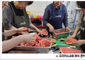
▲ 조이어스교회 부식 준비