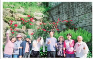
▲ 5월의 장미와함께