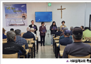
▲ 사부집례교회 특송