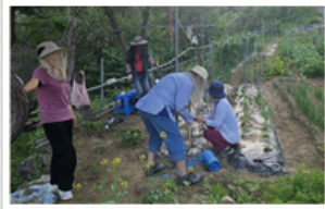
▲ 뒷밭 농사