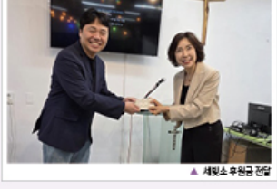
▲ 세빛سو 후원금 전달