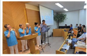
▲ 오카리나 독송